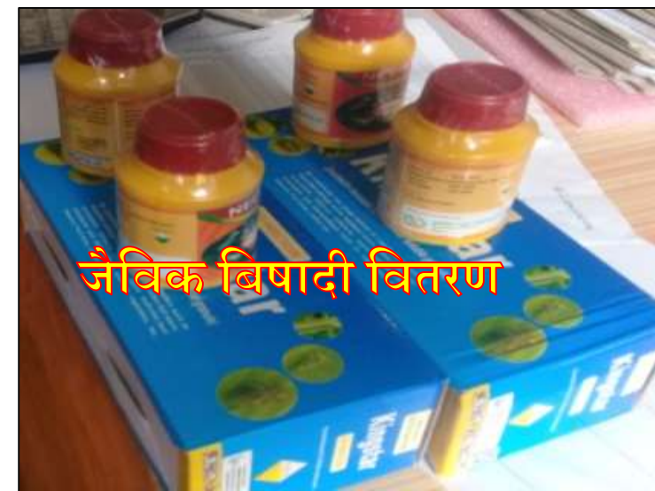
जैविक बिषादी वितरण