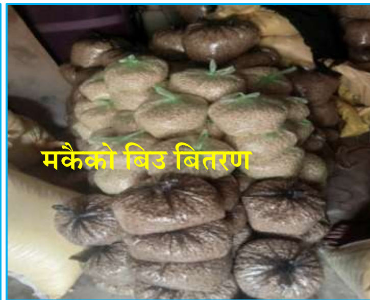
मकैको बिउ बितरण