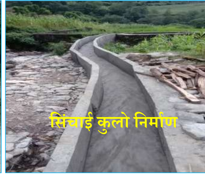
सिंचाई कुलो निर्माण