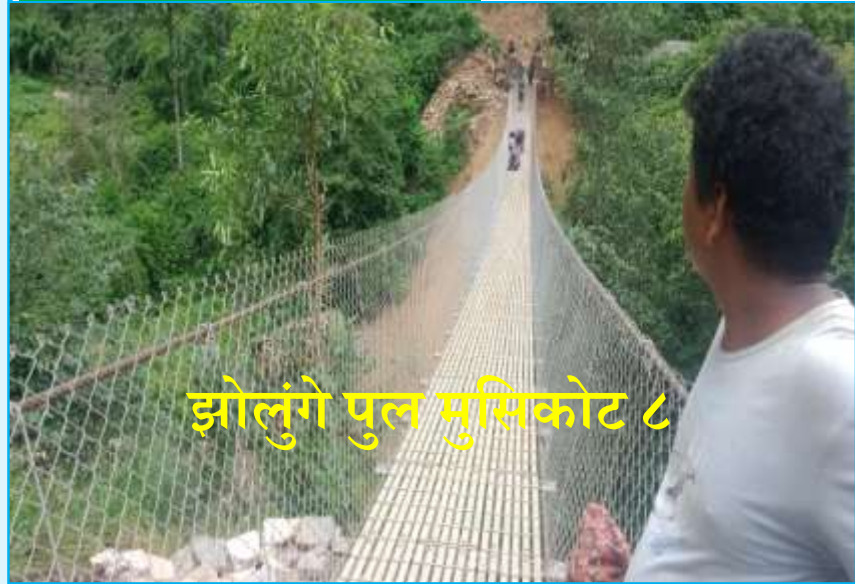
झोलुंगे पुल मुसिकोट ८