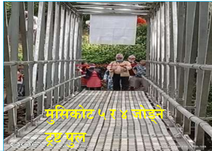
मुसिकोट ५ र ४ जोड्ने ट्रष्ट पुल