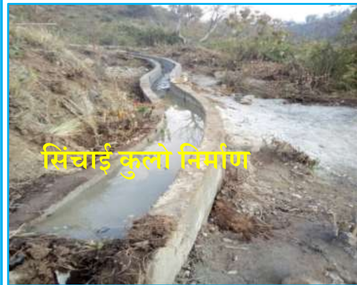
सिंचाई कुलो निर्माण