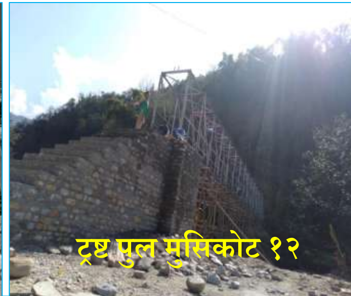
ट्रष्ट पुल मुसिकोट १२