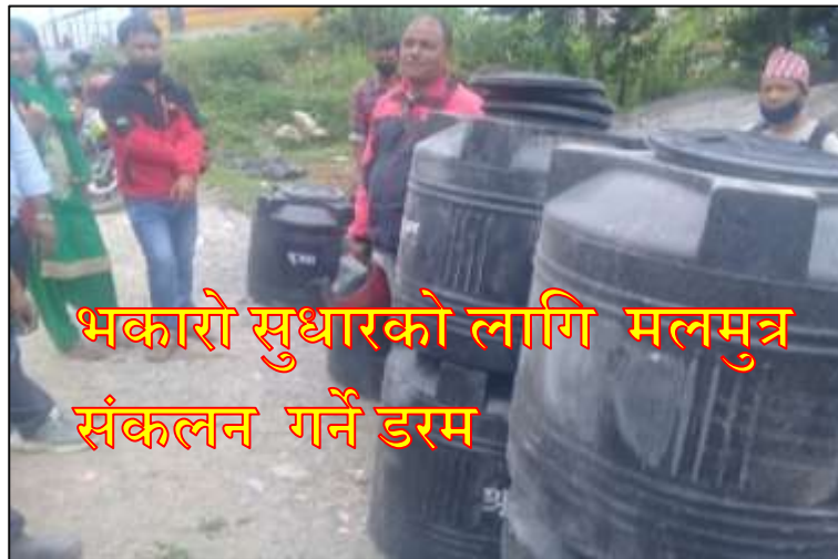
भकारो सुधारको लागि मलमुत्र संकलन गर्ने डरम