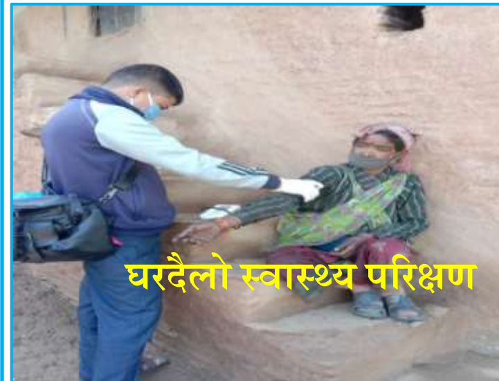
घरदैलो स्वास्थ्य परिक्षण