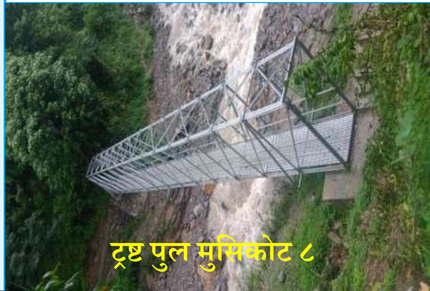
ट्रष्ट पुल मुसिकोट ८