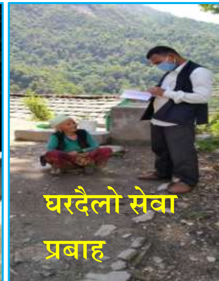
घरदैलो सेवा प्रवाह