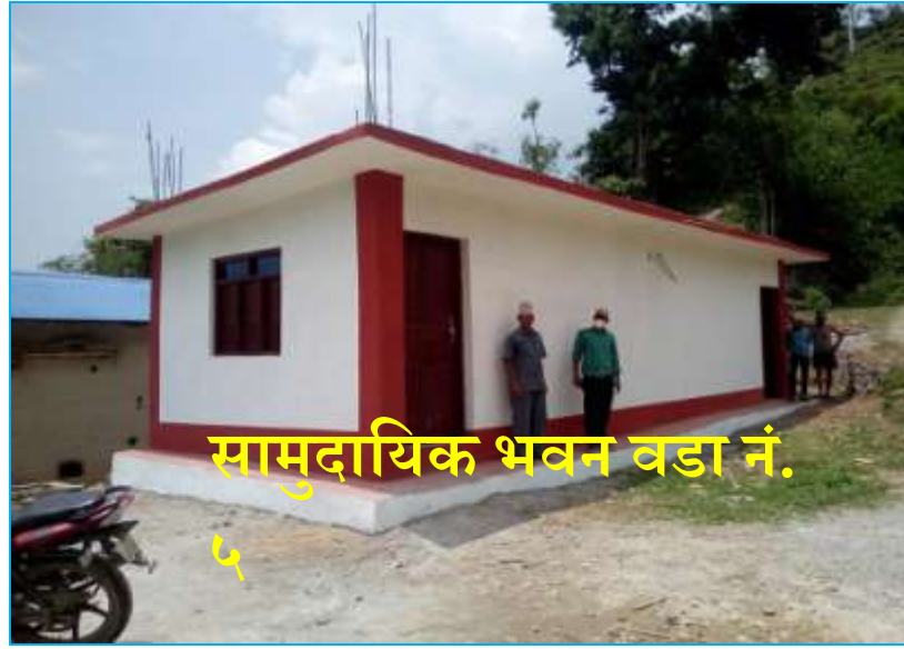
सामुदायिक भवन वडा नं. ५