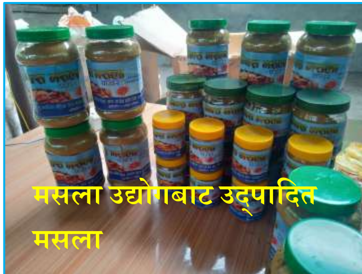
मसला उद्योगबाट उत्पादित मसला