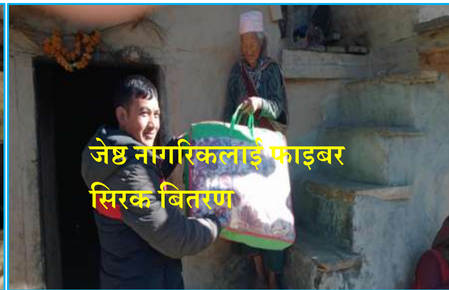
जेष्ठ नागरिकलाई फाइबर सिरक बितरण