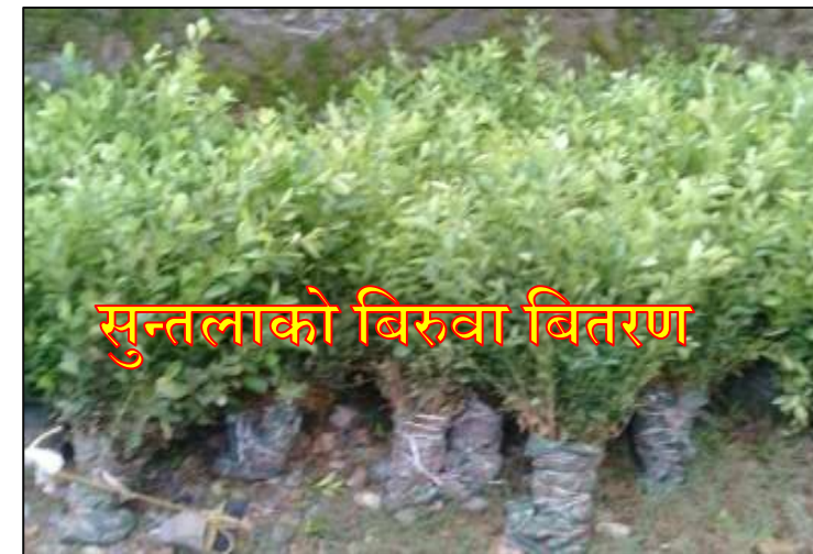
सुन्तलाको बिरुवा वितरण