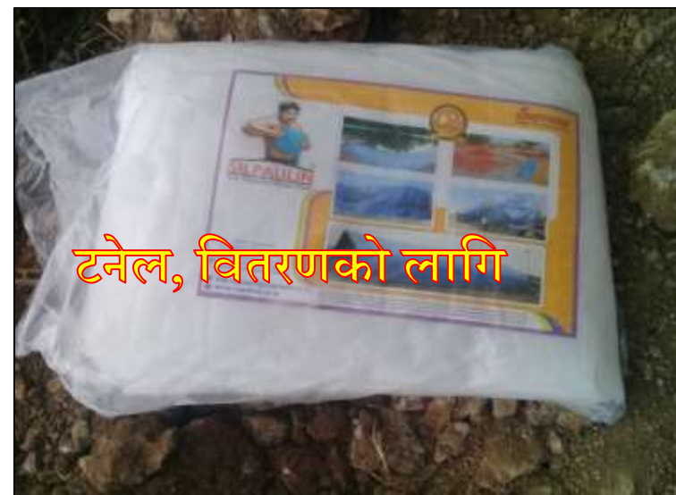
टनेल, वितरणको लागि